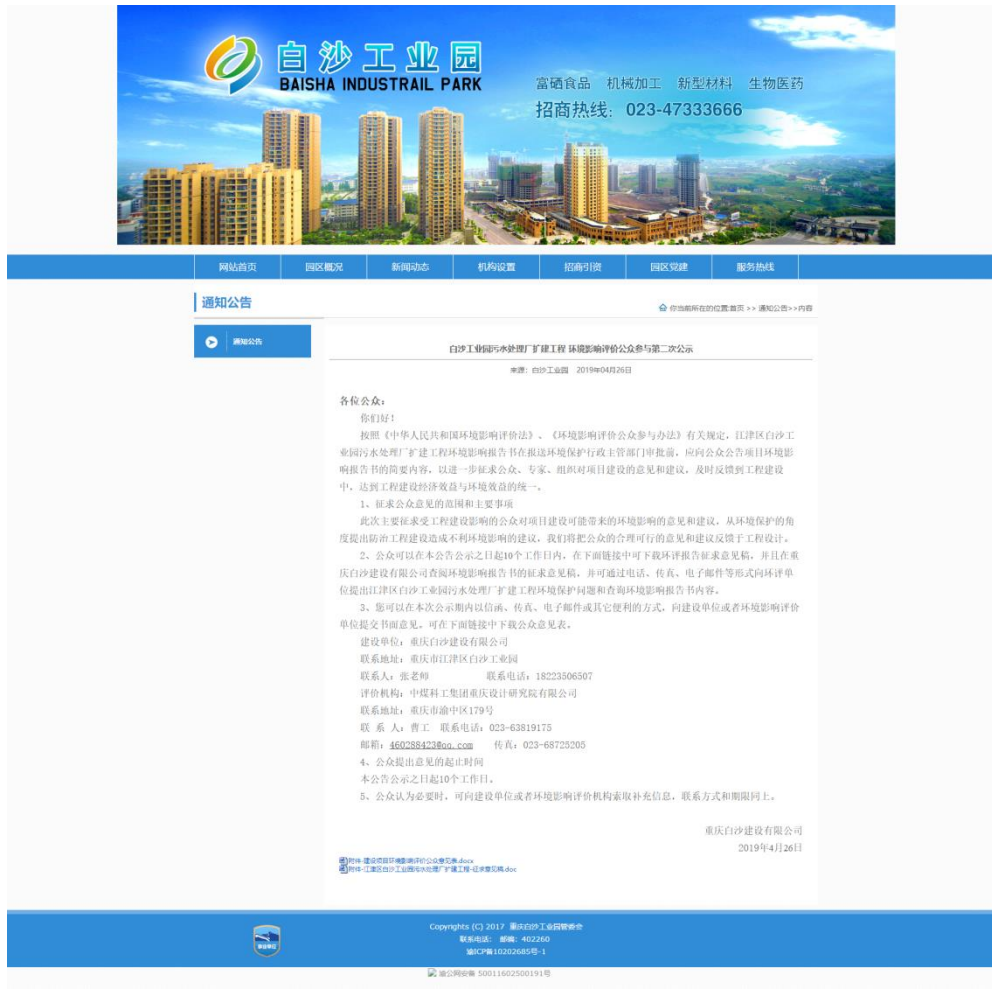
图 2-2 征求意见稿网上公示截图