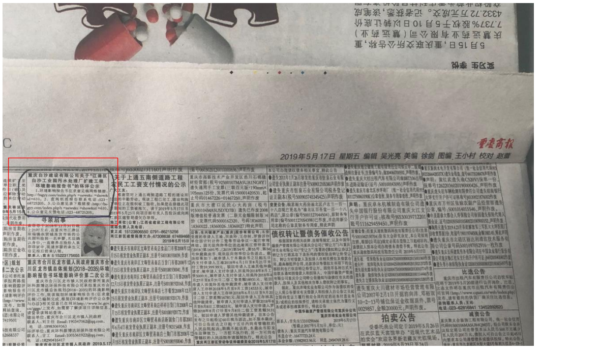
图 2-3 重庆商报环评公示图片