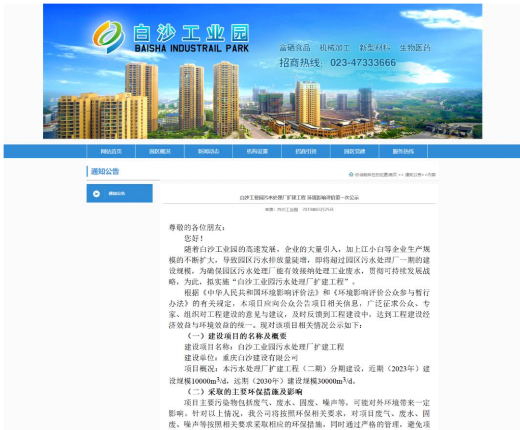
图 2-1 首次环境影响评价信息公开网略截图