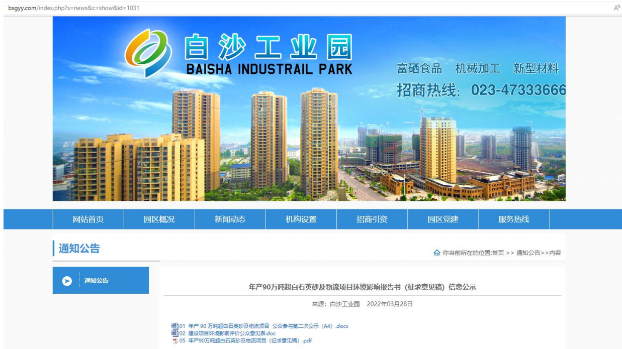
图 3-1 征求意见稿网络公示页面截图

bsgyy.com/index.php?s=news&lc=show&id=1028 ，征求意见稿网络公示页面截图见图 3-1。