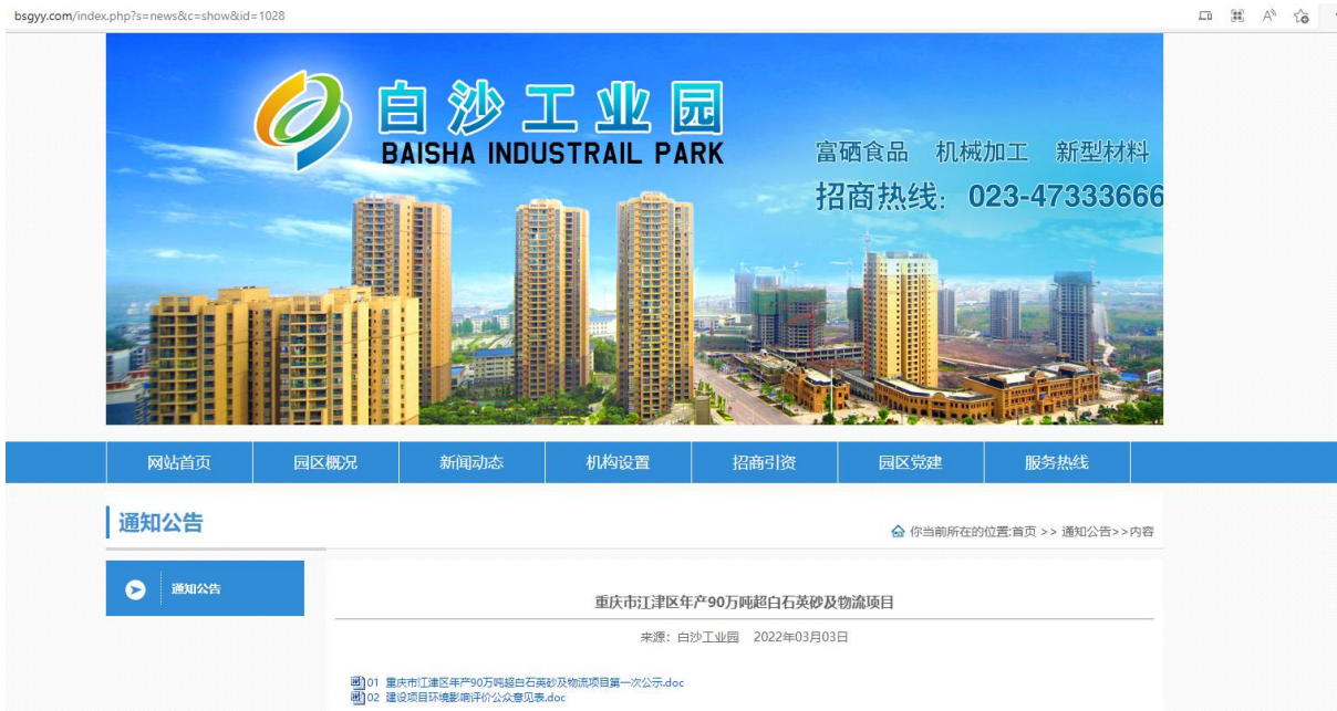
图 2-1 公众参与第一次网络公示页面截图